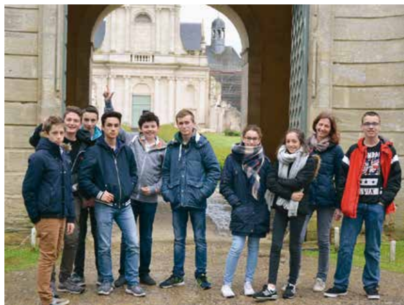
Le groupe des confirmands, à la fin de leur week-end à l'abbaye de Mondaye, près de Caen où ils ont pu échanger avec les moines et approfondir le sens du sacrement qu'ils ont reçu 3 semaines plus tard.