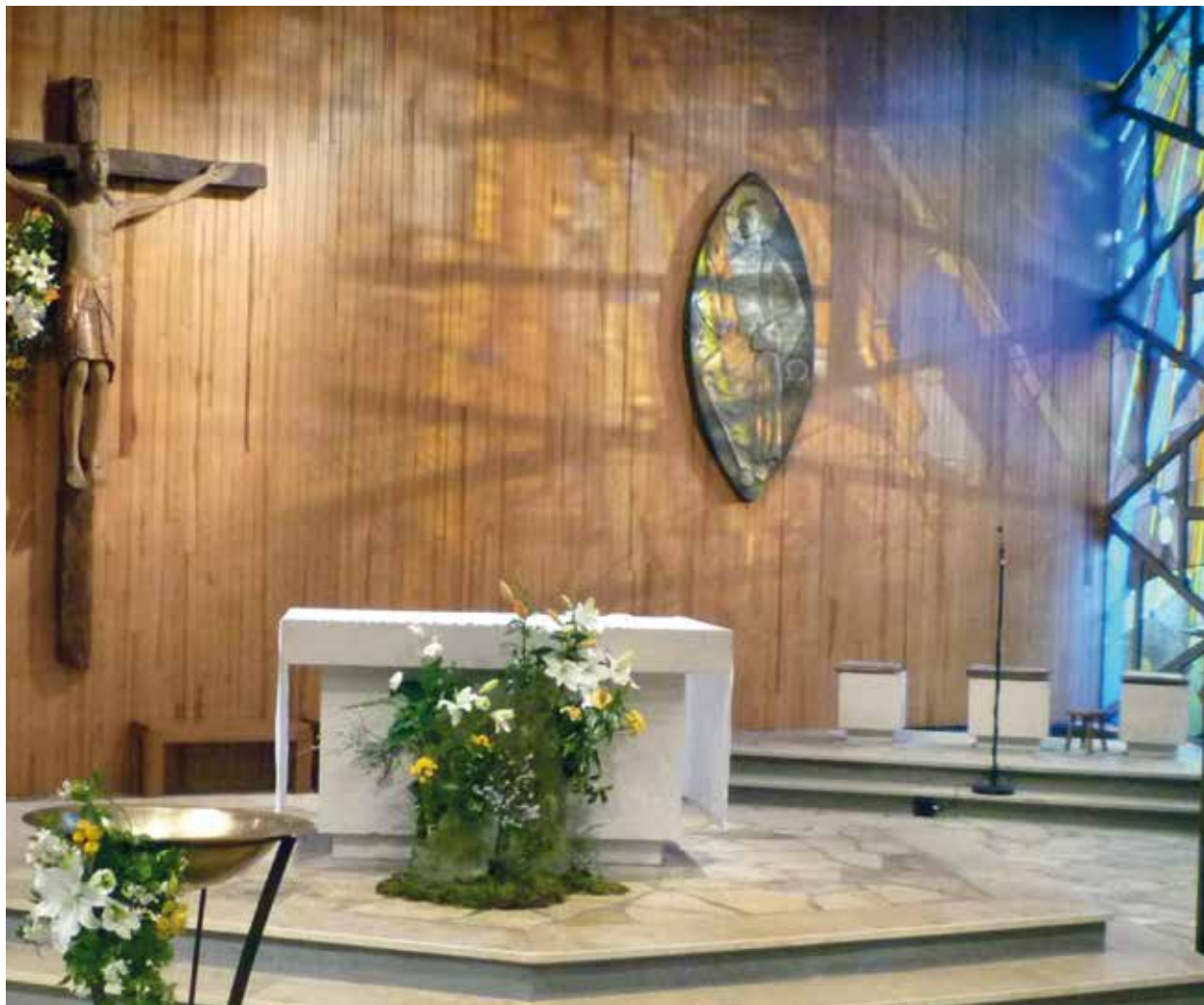
Les arrangements floraux à l'église Jean Bosco pour Pâques