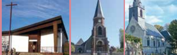
Saint Jean Bosco Franqueville Belbeuf