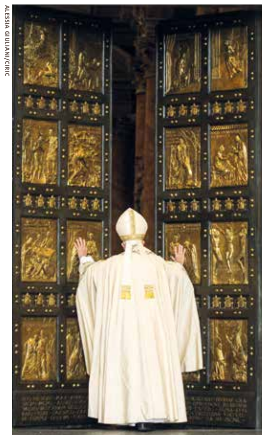
8 décembre 2015 : le pape François ouvre la porte sainte de la basilique Saint-Pierre au seuil du jubilé de la miséricorde.