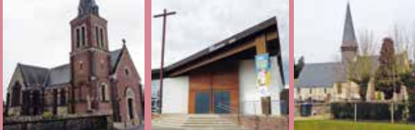
Saint-Aubin Celloville Saint-Jean-Bosco Gouy