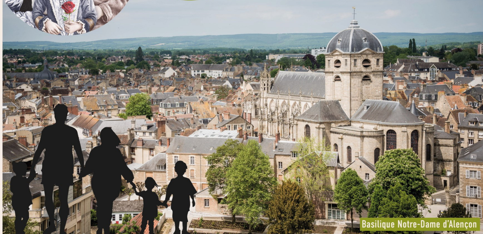
Basilique Notre-Dame d'Alençon

Parcours découverte, enseignements, confessions, spectacle pour les enfants, messe célébrée par les évêques présents