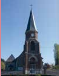
Saint Pierre de Franqueville