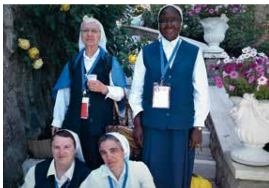
Les 4 Soeurs de la Présentation de Marie.

Alors je vous emmène à Montpezat-sous-Bauzon, petite commune située au cœur du parc naturel régional des Monts d'Ardèche.