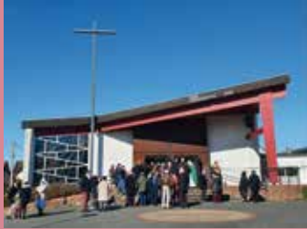
Saint Jean Bosco