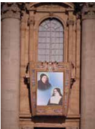
Portrait de sainte Marie Rivier lors de sa canonisation à Rome.