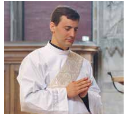
Ils ont dit une première messe à Bonsecours, le mercredi 6 juillet.